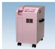
酸素供給装置 (初期費用に含む)