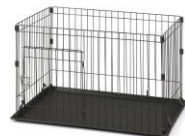
ケージ (希望者無料貸出)