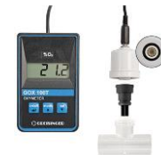
酸素濃度計 オプションレンタル(有料)