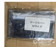
ビニールカバー (有料 小、中、大)