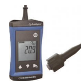
酸素濃度計 オプションレンタル(有料)