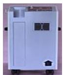
酸素供給装置 (初期費用に含む)