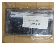
ビニールカバー (有料 小、中、大)